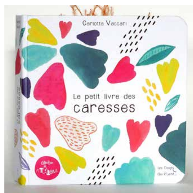
LE PETIT LIVRE DES CARESSES Carlotta Vaccari