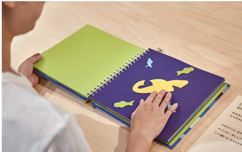
「おおきないろいろなサメのおはなし」《L'histoire du Grand Requin Jaune》(“The Big Yellow Shark Story”), by Régine Gondeau, Les Doigts Qui Révent, 1996.

With them, we will all be taken on an adventure to explore somewhere new.