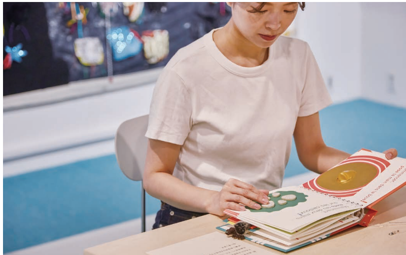
「ちっちゃなて、ちっちゃなおやゆび」-Petite Main, Petit Pouce- ("Small Hand, Tiny Thumb"), by Martine Perrin, Éditions du Seuil, 2012. Tactile adaptation by Marine Tellier and Solène Négrier, Les Doigts Qui Rêvent, 2017.